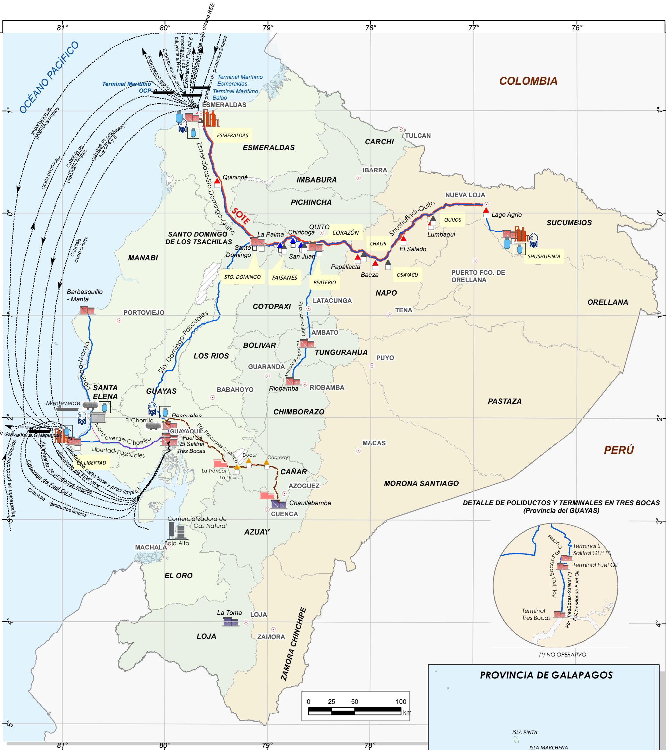
DETALLE DE POLIDUCTOS Y TERMINALES EN TRES BOCAS (Provincia del GUAYAS)